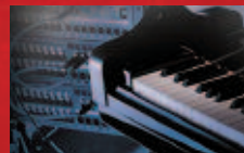
Stage & Studio

Silent Pianos™ vereinen das Beste aus akustischen und digitalen Pianos.